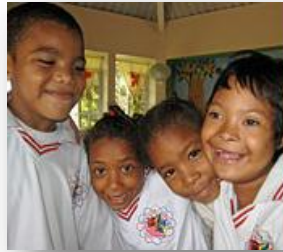
Tagesschule für behinderte Kinder in Cartagena, Kolumbien (P12)