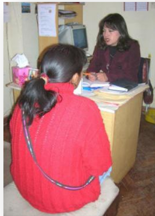
Beratungsstelle für Gewaltopfer in Oruro, Bolivien (P11)