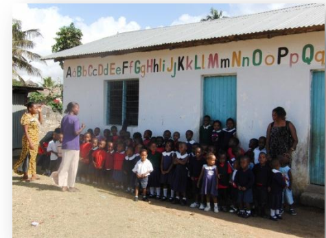
Schule und Gesundheitszentrum in Kisumu, Kenya (P17)