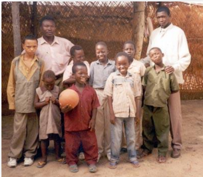
Sonderschule für geistig behinderte Kinder in N'Djamena, Tschad (P3)