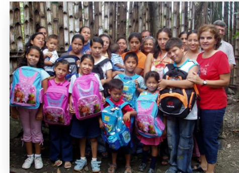
Schulpatenschaften in Daule, Ecuador (P6)