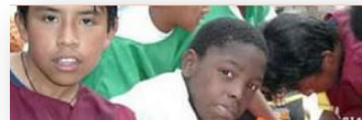
Mission Don Bosco in Ankilioaka, Madagaskar (P13)